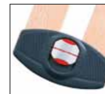
Immagine 2: Regolazione zona lombare • Consentono la regolazione della zona lombo sacrale secondo le proprie esigenze. Quanto più si spostano i distanziatori verso l'esterno tanto più aumenta la rigidità, consentendo di personalizzare la risposta alle sollecitazioni date dal proprio peso corporeo

Immagine 1: Variatore di rigidità • Consente la regolazione di tutte le doghe in maniera indipendente, in tre diverse posizioni (rigida, media o morbida), secondo le proprie esigenze, consentendo di personalizzare la risposta alle sollecitazioni date dal proprio peso corporeo