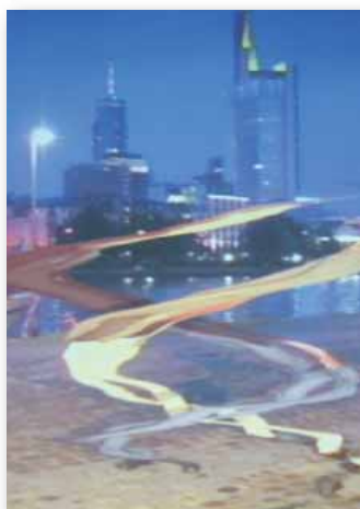
William Forsythe

I possessori di Carta in Cooperazione hanno diritto all'ingresso agli spettacoli del Festival Futuro Presente (Auditorium Melotti) al costo di 10 euro anziché 15, mentre potranno acquistare la FestivalCard del Festival Oriente Occidente (settembre) a 5 euro anziché 10 e avere un conseguente sconto del 50% sul biglietto di ingresso agli spettacoli. Infine, l'associazione riconosce ai possessori di Carta In Cooperazione uno sconto del 10% sulle iniziative organizzate presso il CID.