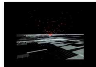
Ryoji Ikeda