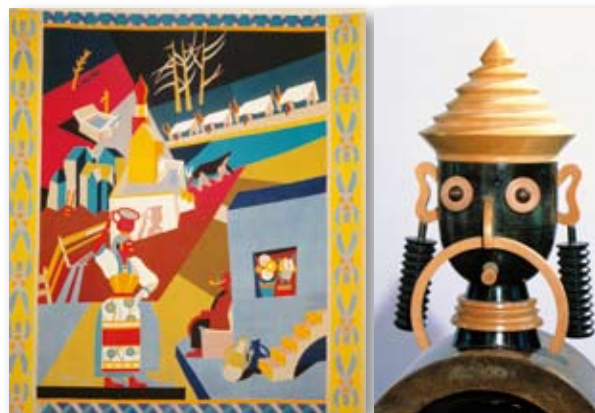
Due opere di Fortunato Depero: Serrada, 1920, panno di lana applicato su canovaccio di cotone; Testa di Chinese [1930-1934] legno tornito (Rovereto, Mart)

La riapertura della sede completa un percorso museografico che condurrà il visitatore attraverso il centro storico di Rovereto e altri punti di interesse della città, come il Museo della Guerra e il Museo Civico. (c.g.)