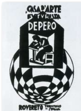
Fortunato Depero - Bozzetto dell'insegna Casa d'Arte Futurista Depero, 1921 - 1923.