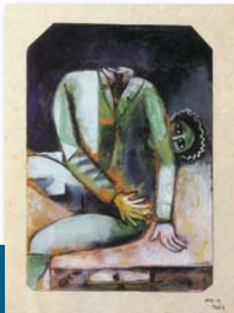
Marc Chagall, Présentation, 1912-1913 Stuttgart

A 100 anni dalla pubblicazione del Manifesto del Futurismo, rimane intatta la forza d'innovazione dell'importantissimo movimento artistico promosso da Filippo Tommaso Marinetti nel 1909. Il Mart celebra il centenario della maggior avanguardia italiana rileggendola con un nuovo sguardo, che ne ricostruisce la composta trama nel contesto storico del primo novecento. In collaborazione con un'esposizione ai Musei Civici di Venezia, il progetto mette in risalto l'intreccio di nuove visioni, di tecniche e linguaggi rivoluzionari. La mostra, con un percorso pressoché inedito, chiarisce come il Futurismo italiano abbia incontrato e influenzato le avanguardie artistiche tedesche e russe. Da una parte vengono prese in esame le relazioni con gli artisti che hanno partecipato alla storia artistica tedesca di “Der Sturm”, come Marc Chagall, Vasilij Kandinskij, Paul Klee, August Macke, Franz Marc, a dimostrazione di quanto il futurismo ebbe forti legami con il Paese dell'espressionismo. Dall'altra il leggendario viaggio di Marinetti in Russia nel 1914 fornisce il filo conduttore per analizzare i rapporti con i pittori cubo-futuristi russi. Fu infatti un intreccio fondamentale quello sviluppatosi tra Roma, Parigi e Mosca tra i pittori futuristi e gli artisti russi, da Mikhail Larionov a Alexandra Exter, da Natalia Goncharova a Olga Rozanova e molti altri ancora. (c.g.)