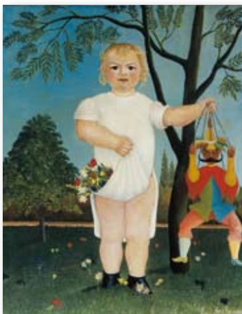
Henri Rousseau, Per festeggiare il bambino! , 1903, Donazione degli Eredi di Olga Reinhart- Schwarzenbach, 1970

MartRovereto Corso Bettini, 43 38068 Rovereto (Tn) numero verde 800 397 760 tel. +39 0464 438 887 info@mart.trento.it www.mart.trento.it