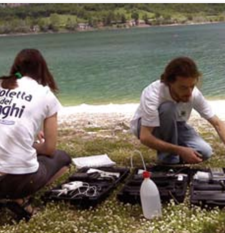
Alcune immagini delle tante campagne che Legambiente rinnova ogni anno

le Bandiere Verdi e Nere assegnate dall'associazione alle buone e cattive pratiche con Carovana delle Alpi (prevista anche per l'estate 2010), che mette in campo trekking, dibattiti, incontri, mostre e altro. Legambiente deve inoltre seguire l'attività politica, quindi scrivere osservazioni a leggi e regolamenti, organizzare conferenze stampa sui vari temi in agenda, incontrare gruppi ed esponenti politici. Ci sarebbe molto altro da raccontare. Però anche la sintesi fin qui trascritta rende l'idea del notevole lavoro che porta gli attivisti di Legambiente a tracciare nelle valli alpine una fitta rete di contatti, competenze, anche conflitti ed elaborazioni politiche, tecniche, disciplinari. Legambiente vive nelle Alpi e ad esse offre una sua narrazione della sostenibilità come delle sue genti e dei suoi territori, offre anche alcune