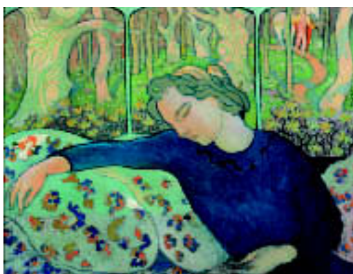
“Fanciulla addormentata” di Maurice Denis al Mart di Rovereto.

Proprio per la vastità del patrimonio ospitato, la collezione permanente è soggetta a diversi allestimenti che privilegiano di volta in volta un diverso tipo di percorso espositivo. Ecco gli attuali.