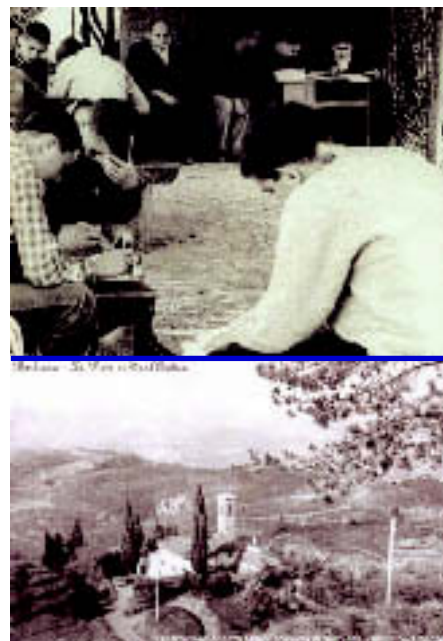
A Barbiana «la scelta di povertà austera di don Milani si radicalizzò». Non teneva nulla per sé. Tutto andava per i ragazzi della sua piccola scuola.

Nel 1965 don Milani prese pubblicamente posizione contro gli insulti rivolti da un gruppo di 20 cappellani militari agli obiettori di