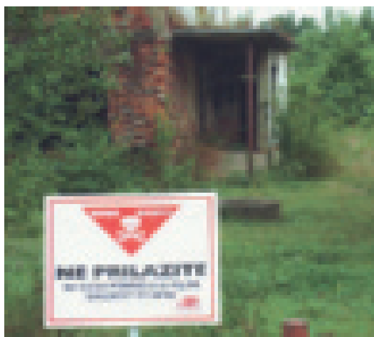
Zona minata davanti ad una casa con bambini, alla periferia di Glina.

Il 6 di agosto ricominciamo il nostro viaggio, e senza volerlo andiamo di nuovo a sbattere contro la Storia. Attraversando un paese pochi chilometri dopo l'uscita da Prijedor, vediamo una gran folla, che aspetta vicino alle macchi-