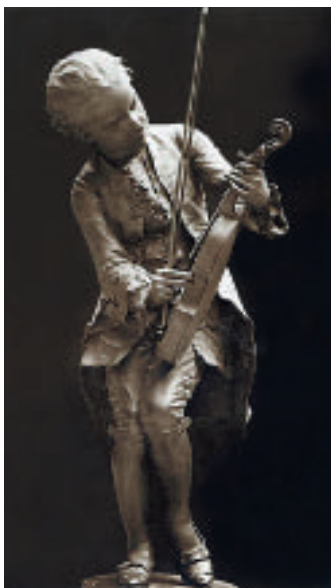
Mozart fanciullo che accorda il violino. Stampa da una scultura di Ernesto Barrias. Parigi, Museo del Lussemburgo.