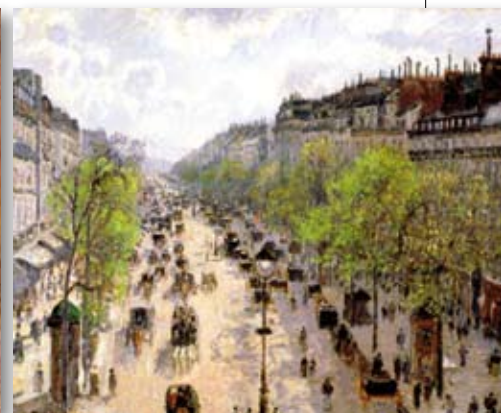
A destra: Camille Pissarro - Boulevard Montmartre: primavera, 1897. Olio su tela, 65x81 cm. The Israel Museum, Gerusalemme.

IMPRESSIONISTI E POST-IMPRESSIONISTI. CAPOLAVORI DALL'ISRAEL MUSEUM DI GERUSALEMME