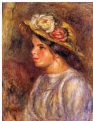
A sinistra: Pierre-Auguste Renoir (Limoges, 1841 - Cagnes-sur-Mer, 1919) Ritratto di Gabrielle, 1906 circa. Olio su tela, 48,6 x 39,4 cm. Dono dell'Edward D. Mitchell Estate agli American Friends of the Israel Museum