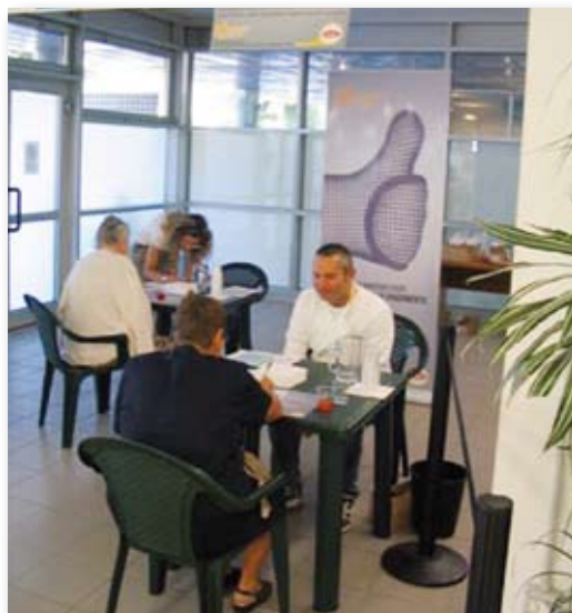
Uno dei test "Approvato dai soci" effettuato in Trentino

Il test "Approvato dai soci" è una nuova via di comunicazione sempre aperta, come dimostrano i partecipanti a questo tipo di valutazione: ben 24 mila in un anno. Moltissimi anche i partecipanti alle serate La Famiglia Cooperativa "Incontra"